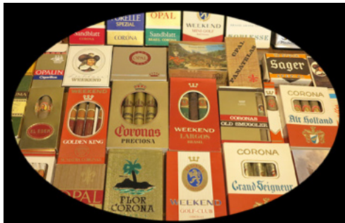
Ein winziger Ausschnitt aus der Böjurer Stumpen- und Zigarrenfabrikation.

Mit der Vernissage am 1. November 2019 im Löwen-Foyer startet die Schluss-Ausstellung des «Tubakjahrs» von Zeitreisen Beinwil am See.